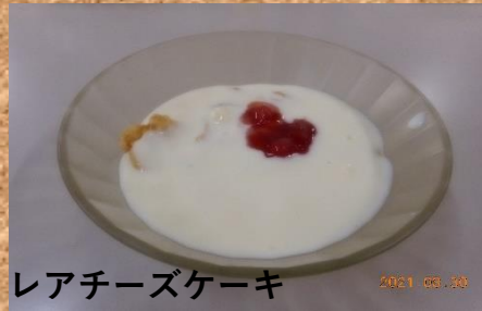
レアチーズケーキ