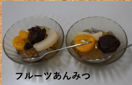
フルーツあんみつ